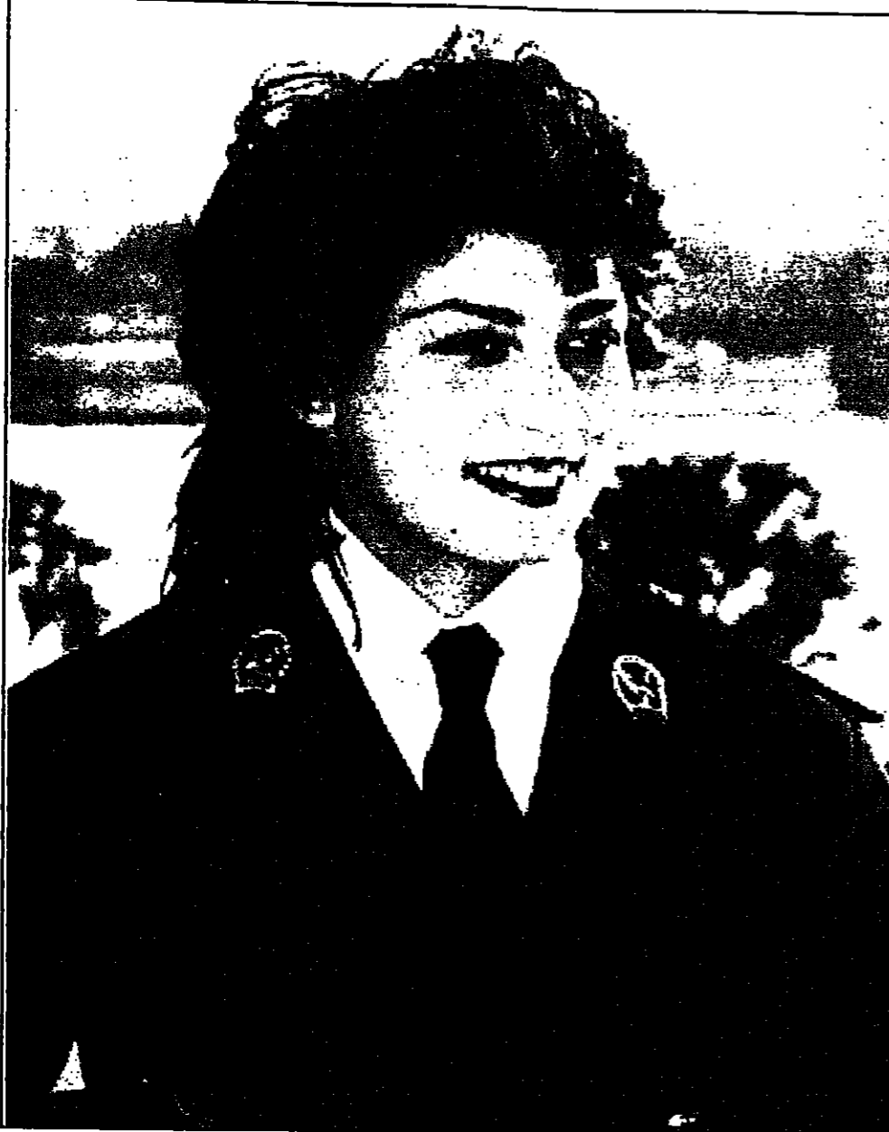
لثلاثة الساعات سماع انوار اجريت لها عملية جراحية جديدة تم فيها زرع مسمارين وهي العملية الثالثة والعشرون التي تجري لها بعد اسبابها في حادث سيارة. سماع مسافر الخارج بعد شربون لاجراء عملية اخرى.

تقريبا، ويقطع القطار المسافة بين اكبر مدينتي لنانيا في 55 دقيقة فقط بدلا من ثلاث ساعات حاليا. وقال جون شرايتمان مدير الخط للقيام بتجربة القطار فائق السرعة بانه المستحيل. لقد اخترنا وحسنا التكنولوجيا على مدار ثلاثين عاما ونحن مستعدون لقيامه الآن. وتكتمل تكاليف المشروع الحكومية الانائية وكوسونديوم شركات من بينها ايربوس وسيمتس وتيسن ويقعون تماما في ان دولا اخرى مستقبلي التكنولوجيا بعد ان يبدأ تشغيل القطار ويحقق ارباحا كما تمكثه لوقتها وهدية السكك الحديدية الانائية اسمها في المشروع. وتشمل الخطط المستقبلية مد الخط الى امستردام غربا ودرسدن وبراغ في الجنوب. ويقتصد مصنعو القطار والمطوون في الصناعة ان القطار يمكن ان يجتذب المسافرين سواء جوا او بالسيارات لساعات تتراوح ما بين 200 و80 كيلومتر. ويقول شرايتمان ان القطار فائق السرعة اكثر امنا من اي قطار سريع لخرسوا في فرنسا او لنانيا او اليابان ويصر على ان من المستحيل ان يخرج من القضبان. وتابع شرايتمان وهو مهندس طائرات طلق محاولا